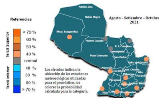
Figura 9: Pronóstico de temperatura mínima media. ASO 2021