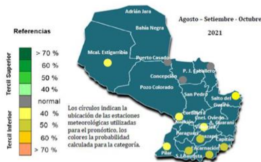
Figura 7: . Pronóstico de Precipitación trimestre . ASO 2021.

En base a las perspectivas climáticas para el Trimestre Agosto–Septiembre–Octubre, se prevén acumulados de precipitación inferiores a la normal sobre gran parte del país, a excepción del extremo norte, en donde se esperan condiciones normales para el trimestre considerado. Así también, temperaturas máximas con valores superiores a la normal sobre gran parte del país, a excepción de algunas áreas del extremo sur, en donde se esperan condiciones normales, en cuanto a las temperaturas mínimas, se prevén valores superiores a la normal sobre el centro, sur y noreste de la Región Oriental y el oeste de la Región Occidental, mientras que, sobre el resto del país se esperan condiciones normales. www.meteorologia.gov.py