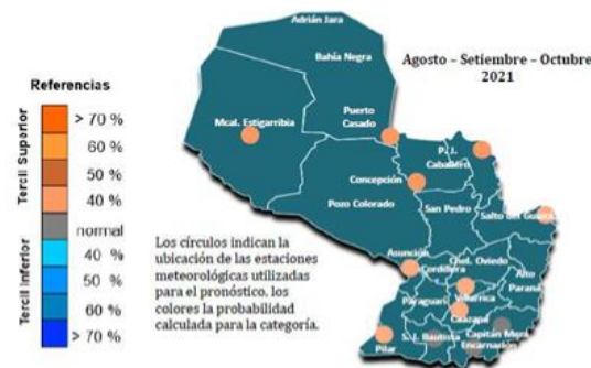
Figura 8: Pronóstico de temperatura máxima media. ASO 2021