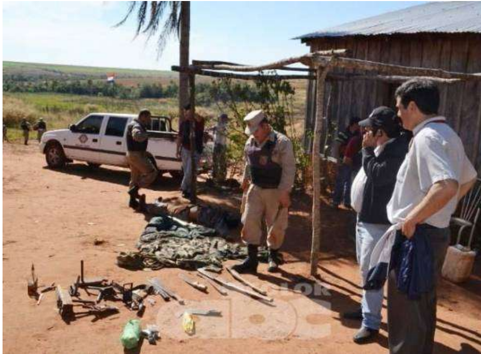
Escopetas, granadas “cazabobo”, machetes, honditas, fueron incautados por policías y fiscales.

CURUGUATY (Corresponsales y enviados especiales). Los agentes policiales que participaron de la intervención en la propiedad de Blas N. Riquelme, después de la terrible balacera, se incautaron de nueve granadas “cazabobo” fabricadas por los invasores, tres escopetas calibre 28, una calibre 22 y una de calibre 20, según los datos obtenidos.