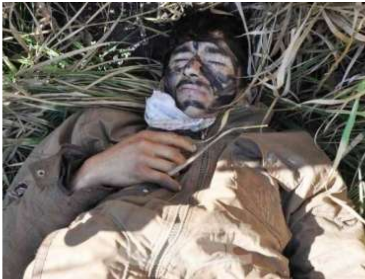
Los campesinos tenían pasamontañas y ropas camufladas.